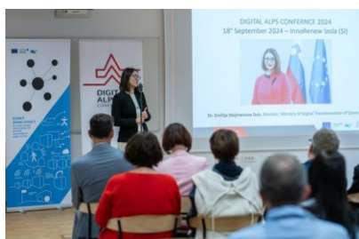
Intervention de Emilija Stojmenova Duh, Ministre slovène de la transformation numérique

Organisée par le groupe d'action (GA) 5 « Connectivité et accessibilité » de la SUERA dans le superbe lieu d'InnoRenew CoE à Izola, sous la présidence slovène de la SUERA et dans le cadre de la Semaine de la côte méditerranéenne et des stratégies macrorégionales, la #DAC2024 a été une incroyable plateforme de partage de points de vue et d'idées sur l'avenir de la transformation numérique dans les zones rurales et de montagne, grâce à un panel d'intervenant.e.s, comprenant notamment Emilija Stojmenova Duh, ministre slovène de la transformation numérique et Stefanos Kotoglou de la DG DIGIT de la Commission européenne.